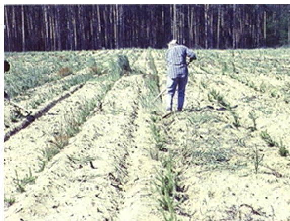
Obr. 3 Ruční kypření v bezprostřední blízkosti stromků po mechanizovaném kypření v meziřahu