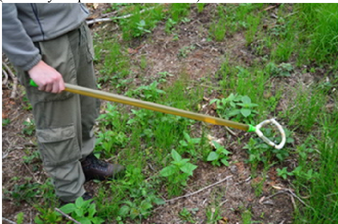
Obr. 4 Knotový aplikátor

V případě, že se rozhodneme pro aplikaci herbicidů (vždy je však třeba dávat přednost jiným postupům), měly by být preferovány herbicidy selektivní, vždy herbicidy bez reziduálních účinků a jejich užití množství by mělo být minimalizováno, např. aplikací herbicidní holí (knotovým aplikátorem - obr. 4).