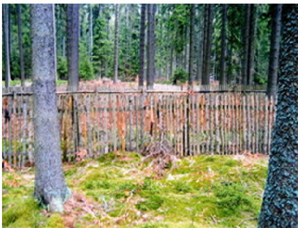
Obr. 6 Dřevěná oplocenka proti zaječím a srnčím zvěřím

Výška oplocenky se zvyšuje ve svahu a v místech tvorby velkých sněhových závějí. Celková výška oplocenky nemusí být vytvořena plotem. Stačí i plot nižší, nad kterým se připevňují výrazně viditelné a s povrchem plotu rovnoběžné zábrany – desky, latě (použití drátu je nepřipustné - obr. 6, 7).