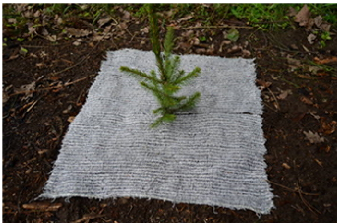
Obr. 1 Mulčovací plachetka

období stahují hlodavci, kteří mohou stromky poškodit, případně lákají černou zvěř, která stromky vyryje.