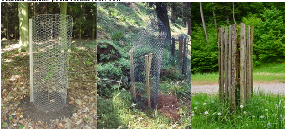
Obr. 16 Oplůtky z různých materiálů (kovové, umělohmotné pletivo nebo dřevo)

Po celém obvodu jednotlivě chráněného stromku je postaven plot – ze dřeva nebo kovového pletiva (málo vhodné je pletivo umělohmotné – pokud není výrazně stabilizované proti UV záření, poměrně rychle se rozpadá). Ohrádka musí být dostatečně vysoká a široká, často je nutná její stabilizace do země zaraženým kůlem. Jde o poměrně drahý způsob ochrany, vhodný je při ochraně malého počtu rostlin (obr. 16).