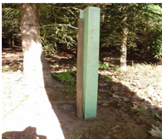
Obr. 12 Plastový chránič po výsadbě buku

Další podrobnosti správného použití plastových chráničů jsou uvedeny ve specializované metodice (Jurásek a kol. 2008, viz kap. 8).