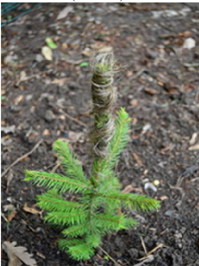
Obr. 18 Ochrana terminálu ovazem koudelí

Ovazy terminálních výhonů - horní třetina terminálního výhonu spolu s terminálním pupenem jsou ovázány materiálem, který zvěř odpuzuje. Klasickým ovazem je koudel, lze použít i proužky nebo rozcupovanou textilií, ovčí stříž apod. Materiály, které se rychle nerozkládají (např. koudel), je nutno v jarních měsících odstranit, neboť mohou zaškrcovat kmen a bránit růstu větví (obr. 18).