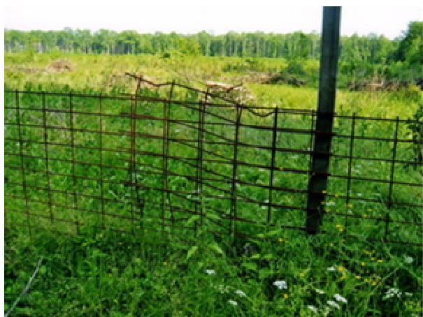
Obr. 10 Oplocenka proti černé zvěři z Kari sítě

Stav plotu je třeba pravidelně a často kontrolovat. Účinnost oplocenky je minimálně do doby zajištění kultury. Oplocenka však může stát i déle v případě, že chráníme dřevinu, která výrazně trpí zvěří. Po skončení doby účinnosti se celá oplocenka odstraňuje a odváží. V případě dobrého stavu materiálu se staví na jiném místě.