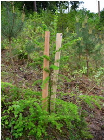
Obr. 17 Ochrana dvěma kůly proti vytloukání

Oplocenky, elektrické ohradníky a všechny způsoby mechanické ochrany chránící celý stromek chrání i proti vytloukání.