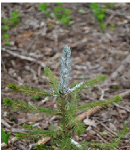
Obr. 21: Ochrana terminálu repelentem proti zimnímu okusu

Repelentem se vždy ošetřuje terminální pupen. Lze ošetřit i celý terminální výhon, v případě ochrany proti bočnímu okusu se ošetřují i boční větve, nejčastěji první přeslen (obr. 21).