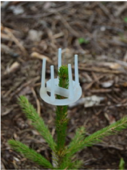
Obr. 19 Ochrana terminálu plastovým bodcovým chráničem