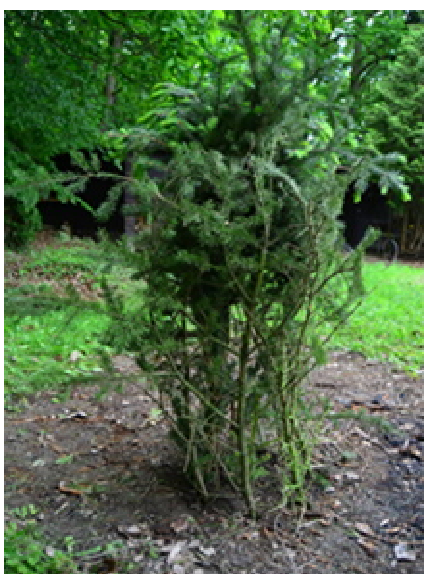
Obr. 15 Opich

Po celém obvodu chráněného stromku zapíchneme rovnoběžně s kmenem silnější větve. Tím vytvoříme ohrádku, která brání přístupu zvěře. Zapíchnuté větve musí být dostatečně silné a dlouhé, aby stromek chránily minimálně 2 roky (omezením přístupu bočního světla je stimulován výškový růst). Pro zpevnění ohrádky je vhodné větve v horní třetině převázat drátem. (Jestliže používáme na ochranu stromků po výsadbě drát, musí se užít pouze tzv. „pálený“ nebo „černý“ drát. Je to speciálně vyrobený drát, který se do dvou let sám rozpadne a stromky nezaškrcuje – platí pro všechny způsoby ochrany - obr. 15).