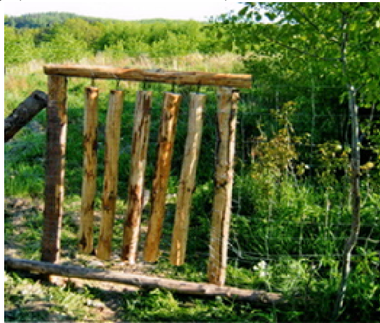
Obr. 9 Oplocenka – vchod pro černou zvěř ze zavěšených polen