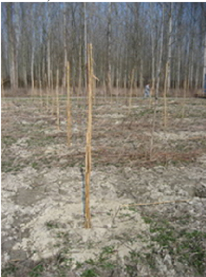
Obr. 20 Ochrana kmene topolu ovazem rákosem

Kmeny lze po celém obvodu obalit papírem, rákosem, uříznutými větvemi (připevňují se „černým“ drátem) nebo jutovými obvazy (chrání i proti přehřívání kmene – vzniku korních spál - obr. 20).