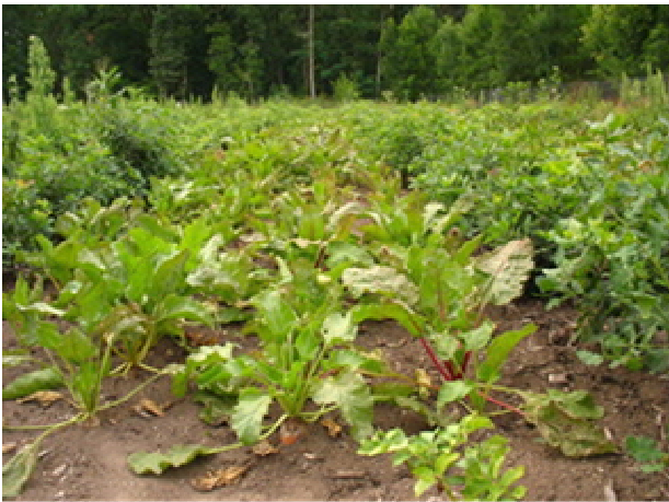
Obr. 5 Polaření řepy v dubu