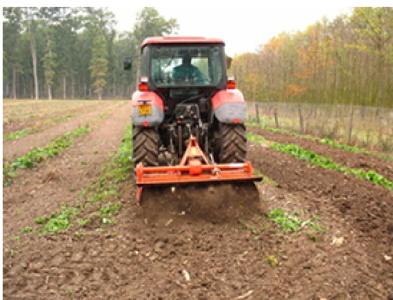
Obr. 2 Mechanizované kypření v meziřahu

Po výsadbě topolů je nutné nejméně po 3 roky udržovat půdu do 2 m od kmene stromů bez plevelů a jiných druhů dřevin (realizuje se opakovaným mechanizovaným kypřením do hloubky cca 10 cm, v bezprostřední blízkosti stromů ručně, lze použít i celoplošné úhorování, mulčování je málo účinné).