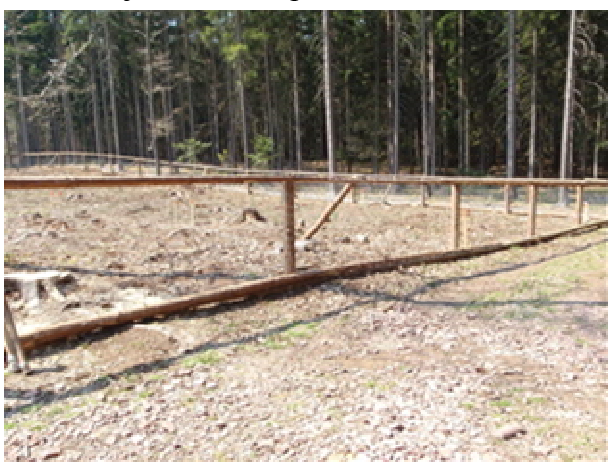
Obr. 8 Oplocenka proti černé zvěři se spodní silnou laťí

Proti černé zvěři je třeba spodní část plotu připevnit tak, aby nešla nadzvednout (lano, silná lať), výhodnější je do plotu instalovat speciální průřezy pro černou zvěř (v plotu lze nechat i otvory, ve kterých jsou volně zavěšena dřevěná polena – černá zvěř tato těžká polena rozhrne, ostatní zvěř ne). Jelikož černá zvěř plot i proráží, vhodné je obornické pletivo, užívá se i železná armatura jinak určená pro železobetonové stavby (Kari síť - obr. 8, 9, 10).