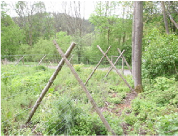
Obr. 11 Oplocenka na horním laně