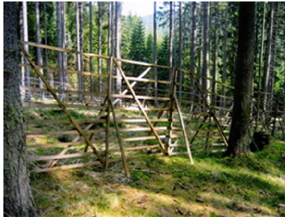
Obr. 7 Dřevěná oplocenka proti vysoké zvěři

Oplocenka nesmí mít ostré rohy (při vyhánění zvěře psem nemá zvěř v ostrém rohu kam odskočit).