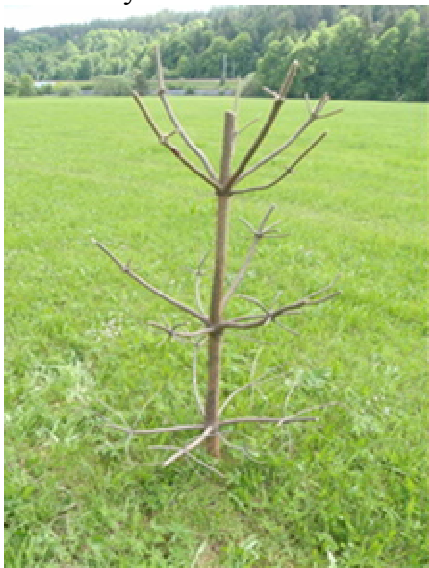
Obr. 14 Rozsocha

se zkracují na délku cca 60 cm, na spodní části rozsochy se udělá špice (obr. 14). Rozsochy lze i uměle vyrobit.